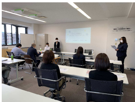
【講師】洛和会京都健診センターの保健師さん

10月22日、協会けんぽ主催の「健康講座」を受講しました。毎年全員参加している講座ですが、今回は密を避けるため各課2名程度が代表しての参加となりました。今回のテーマは「ストレス管理とアンガーマネジメント」です。