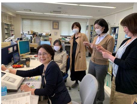
お昼休みにみんなで測定しました♪