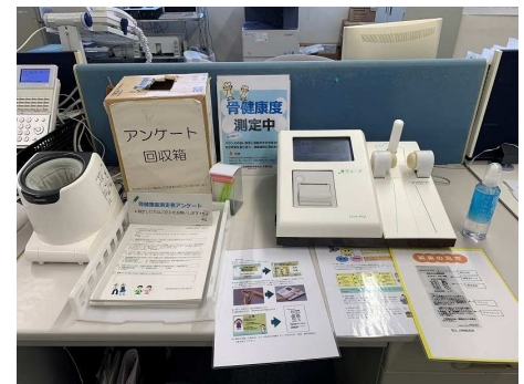
骨健康測定器と血圧計